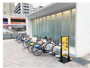
海老名駅西口ステーションはこちらです!

海老名駅西口のステーションは、公衆トイレ横に設置されており、自転車数が数台しか残っていないこともある程、利用されている方が多いようです。 市内の文化財や美味しいものめぐり、相模川沿いをサイクリング、もちろん通学や通勤、お買い物にもと、利用の仕方はいろいろあるようです。