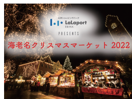
特設会場イメージです。

【開催日時】 12月9日(金) 16時〜20時 12月10日(土)／11日(日) 11時〜20時