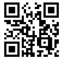
扇町おもいで祭り動画配信中!

当法人は、8月27日(土)の午後3時から9時、海老名駅西口プロムナードなどで「第4回扇町おもいで祭り」を開催いたしました。 「扇町から海老名の新しい文化をつくる。その柱となるお祭りをつくること」を目的に2017年から開催して参りましたが、2年続けて新型コロナウイルスの影響で中止となった関係で、開催を待ち望んだ方たちが、予想を上回る1万人が来場され大成功に終わりました。 「扇町おもいで祭り」は、子どもたちにとつて夏休み最後の週末に「海老名」の「おもいで」をつくって欲しいと願いを込めて企画しました。また来年も更にお楽しみいただけるよう内容を充実して参ります。