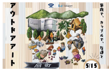
扇町アウトドアパーク開催

きます。 各エリアには25人のチョークアーティストを配置することで、一緒に楽しみながら、アーティストの技を見ることができま す。 イベントコンセプトは、「ユニーノーマルな時代の出来るだけ接触を避けるイベント」としました。 コロナ禍における新たなイベントの在り方を考えるとともに、扇町のイベント開催における目的を考え直しました。 このコロナ禍で企業、行政がイベントの見合わせをしている中、新しいイベントの在り方を発信することで、瞬間的なイ