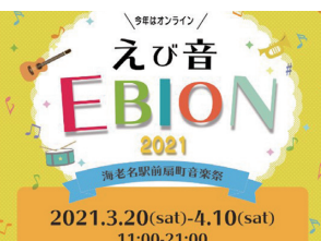
「えび音」オンライン開催

ららぽーと海老名様主催で、海老名駅前扇町音楽祭「えび音」オンラインが開催されました。昨年の中止に続き、今年度はオンラインで、令和3年3月20日～4月10日までの10日間で開催されました。 コンセプトは、有名アーティストの出身地であり、高校生の音楽活動が盛んであり音楽文化が根付く海老名エリア。 扇町の春の一大イベントとして、地元にもマッチングするテーマによる、フレンドリーでハッピーな音楽交流