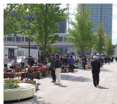
再開した扇町アンティークマーケット

た。 今後も毎月第二土曜日に扇町アンティークマーケットを開催してまいりますので皆様のご来場を心よりお待ちしております。 今後の新型コロナウイルスの状況次第では変更等もございませうので、その点はご留意いただけますようよろしくお願い申し上げます。