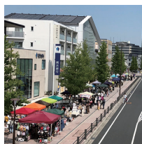
前回のサニーサイドフェスタの様子