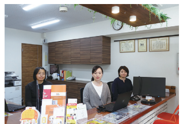
「海老名店」店舗前面に専用駐車場2台有り

当社は綾瀬市に本社を構え、2016年に賃貸に特化した「海老名店」を扇町にオープン致しました。 海老名店は、女性ならではの