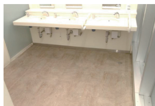
きれいになった西口公衆トイレの床

当法人は、海老名駅西口特定公共施設の指定管理の施設維持管理業務で海老名駅西口公衆トイレの清掃を行っています。 平成28年10月にオープンした海老名駅西口公衆トイレは、4年6カ月が経過して、日常清掃、定期清掃では、落としきれない床の汚れが目立っていました。 この度3月13日(土)の夜間に床面の特別清掃を行い、オープン当時と同じようなきれいな床になりました。ご利用いただく皆様にも気持ちよくご利用いただけると思います。